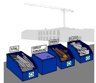
Rys. 1. Segregacja odpadów